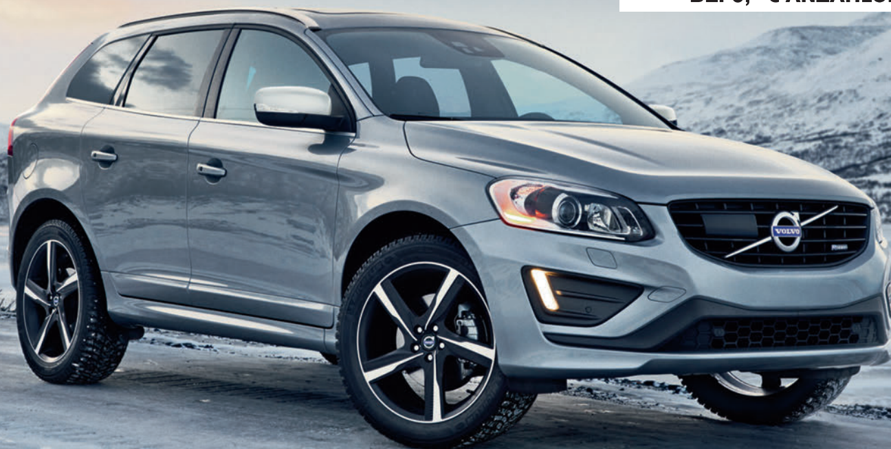
Abb. zeigt Sonderausstattung.

MONATLICHE LEASINGRATE* BEI 0,- € ANZAHLUNG