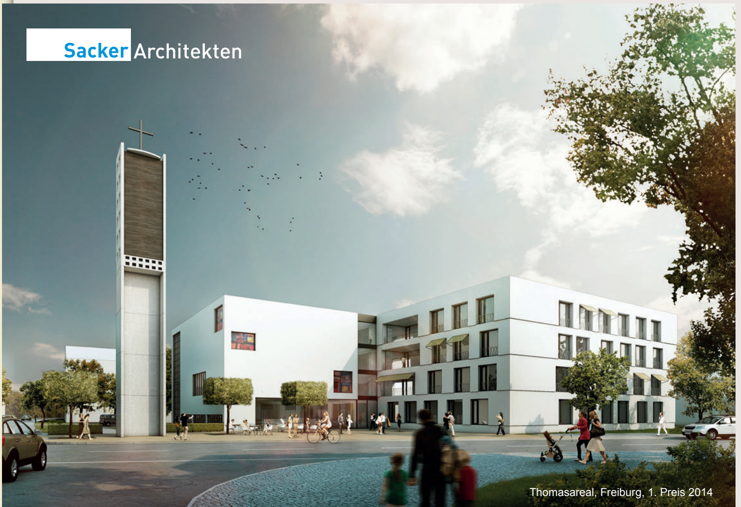
Thomasareal, Freiburg, 1. Preis 2014