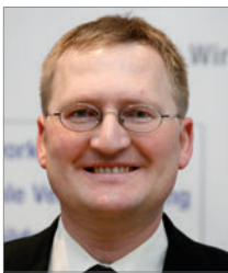
AK Mittelstand und Umwelt